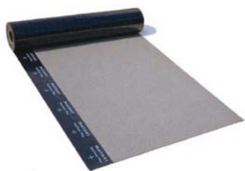
Mataki UnoTech® FR on CE-merkitty