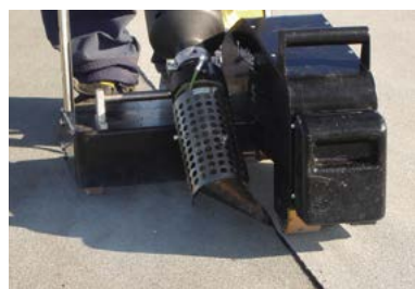
T-Welder hitsauskone on sähkökäyttöinen kuumailmain, joka on nopea käyttää ja minimoi paloriskin lähes täysin.

UnoTech® FR antaa pitkäikäisen vesieristyksen, joka syntyy nopeasti ja turvallisesti. Katon edustava ulkonäkö säilyy muuttumattomana vuosikymmeniä.